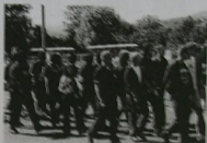
Příloha č. 6