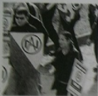
Příloha č. 5