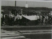
Příloha č. 1

Fotografické přílohy k navštíveným akcím a koncertům: