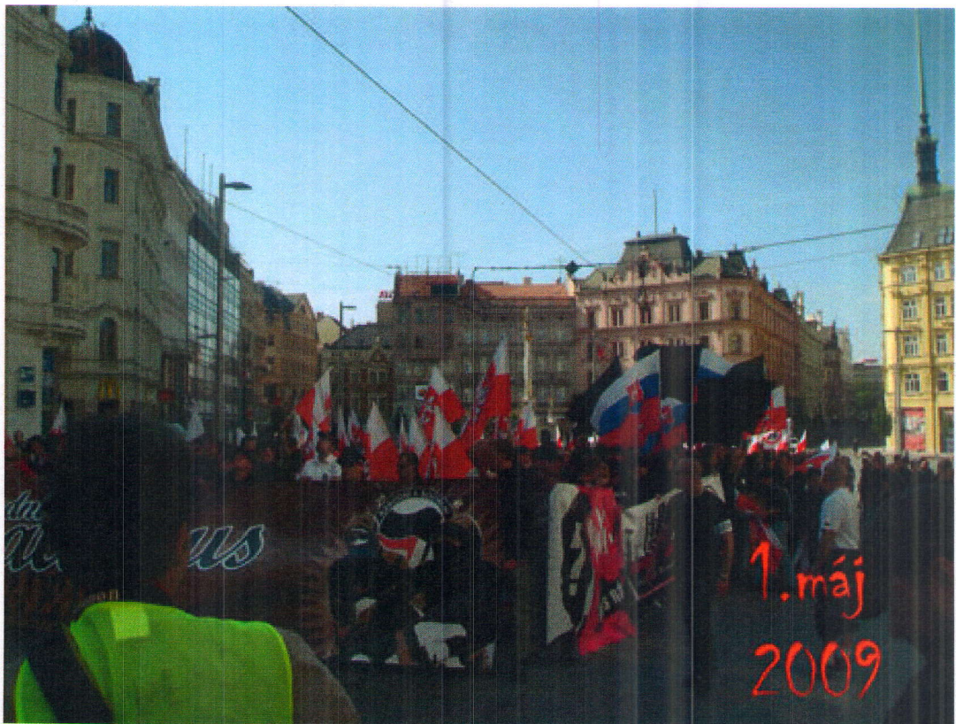
1. květen 2009, Brno