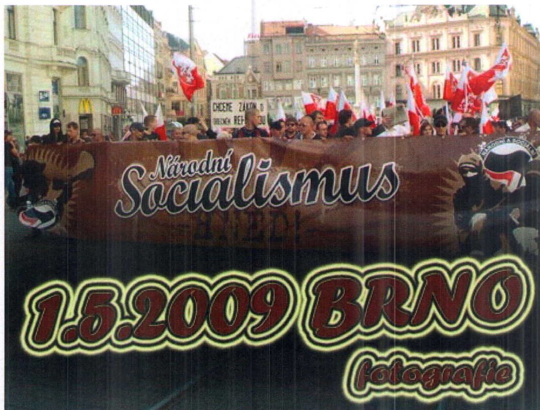
1. květen 2009, Brno