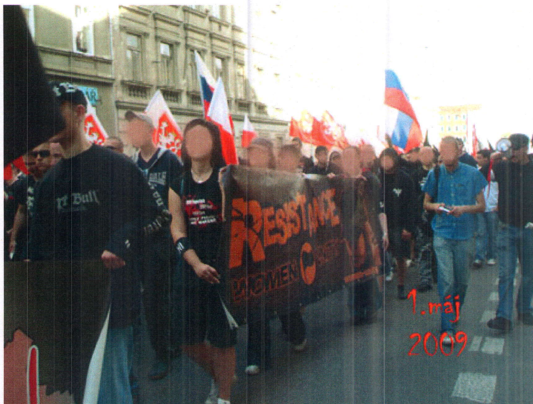
1. květen 2009, Brno