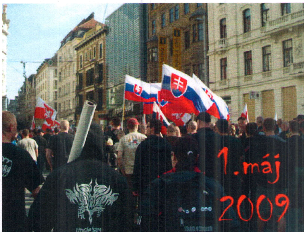
1. květen 2009, Brno