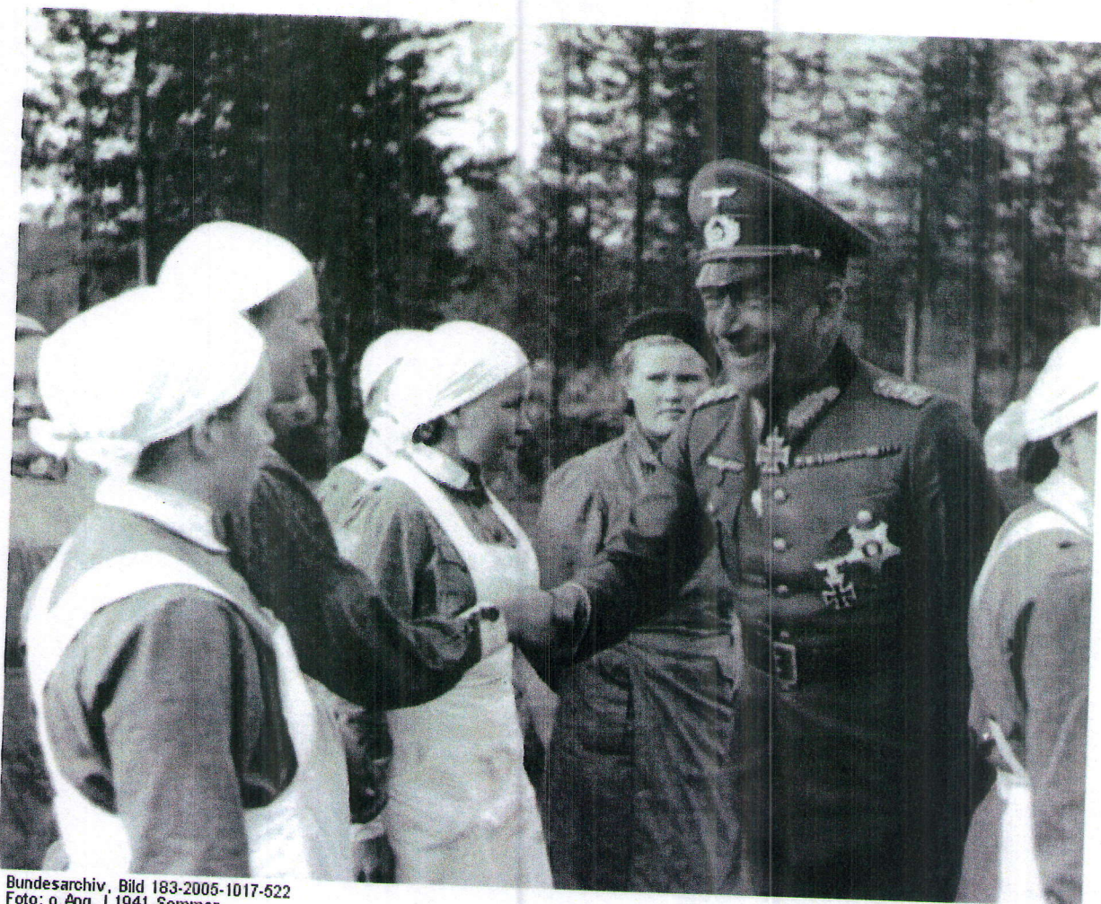
1941 Sommer

avšak nikdy ne na frontě. Tato dětská skupina dosáhla 50 000 členek.