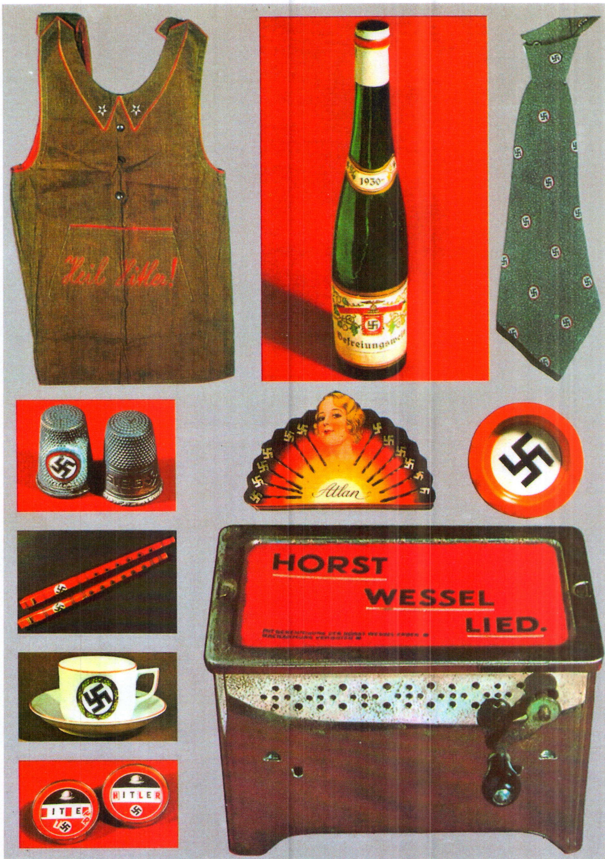
Dobové předměty s nacistickou tématikou